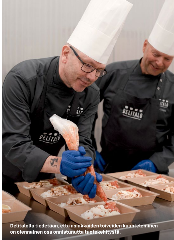
Delitalolla tiedetään, että asiakkaiden toiveiden kuunteleminen on olennainen osa onnistunutta tuotekehitystä.

Delitalon valmisruoka-annokset on pakattu kauniisiin ja ekologisiin pahviastioihin, jotka lapsetkin osaavat itse