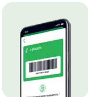
S-ETUKORTIN VIIVAKOODI S-MOBIILISSA

Katso ohjeet: www.s-kanava.fi/s-etukortit/