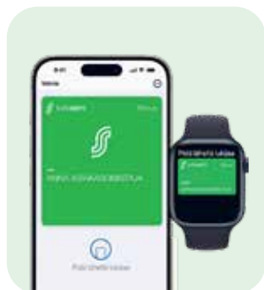
S-ETUKORTTI APPLEN LOMPAKKOON