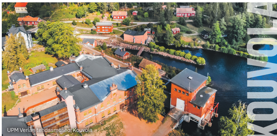
UPM Verlan tehdasmuseo, Kouvola

lisesti toimien edistää osuuskaupan etua. Toimitusjohtaja vastaa siitä, että osuuskaupan kirjanpito on lain mukainen ja varainhoito luotettavalla tavalla järjestetty.