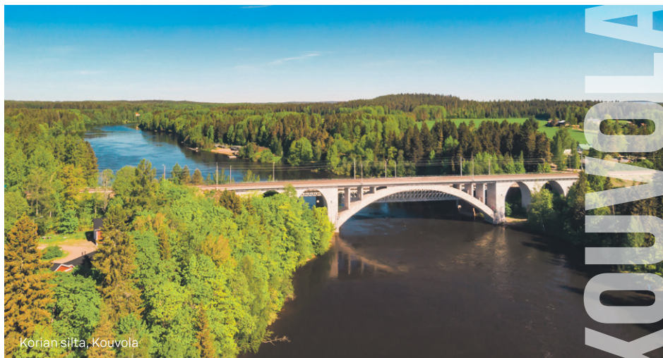
Korian silta, Kouvola

tetuille jäsenille näiden osuuskaupalle ilmoittamaan osoitteeseen ennen äänestysajan alkamista. Painettu vaalimateriaali lähetetään vain Suomessa asuville jäsenille.