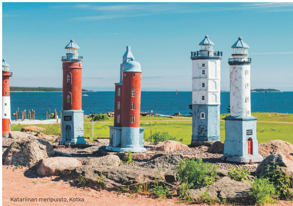
Katariinan meripuisto, Kotka

Kutsu edustajiston kokoukseen lähetetään vähintään seitsemän päivää ennen kokouspäivää, jollei osuuskuntalaki edellytä pidempää kutsuaikaa, kirjallisesti edustajiston jäsenen ilmoittamaan osoitteeseen. Kutsussa on mainittava kokouksessa käsiteltävät asiat.