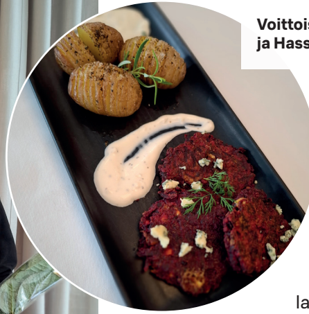
Voittoisa annos, punajuuripihvit ja Hasselbackan perunat.